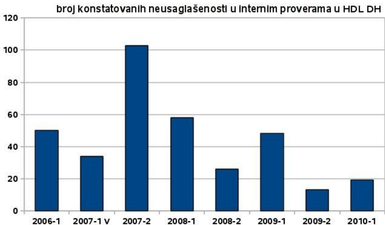
Slika 1. Prikaz broja neusaglašenosti po svakoj izvedenoj internoj proveru u okviru integrisanog sistema QMS i ISMS

Na Slici 1. dat je prikaz broja neusaglašenosti po svakoj izvedenoj internoj proveru od uspostavljanja integrisanog sistema QMS i ISMS